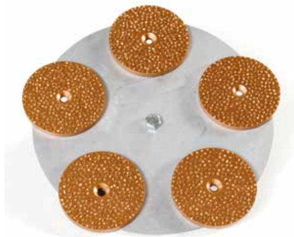
DISCHI IN CARBURO DI TUNGSTENO RIGIDI DA 127 MM. ATTACCO M14

DISCO RIGIDO € 52,00 DISCO RIGIDO DA 127 mm. gr. 3 art. 1114127001003 DISCO RIGIDO DA 127 mm. gr. 6 art. 1114127001006 DISCO RIGIDO DA 127 mm. gr. 10 art. 11141270010010 DISCO RIGIDO DA 127 mm. gr. 14 art. 11141270010014 DISCO RIGIDO DA 127 mm. gr. 24 art. 11141270010024