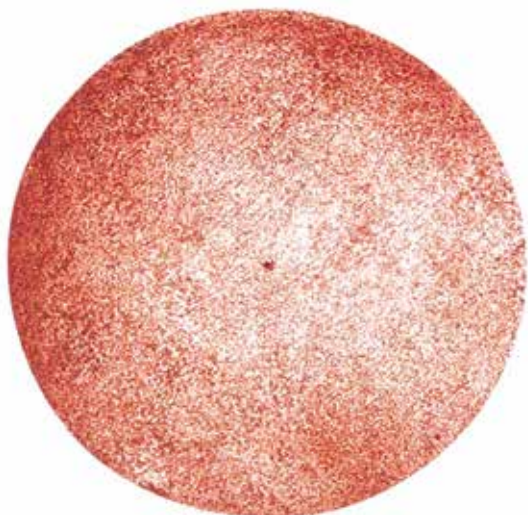
DISCHI IN CARBURO DI TUNGSTENO VELCRATI DA 200-225 MM.

DISCHI DA 225 MM. € 59,20 DISCO VELCRATO DA 225 mm. gr. 18 art. 20012251018 DISCO VELCRATO DA 225 mm. gr. 24 art. 20012251024 DISCO VELCRATO DA 225 mm. gr. 30 art. 20012251030