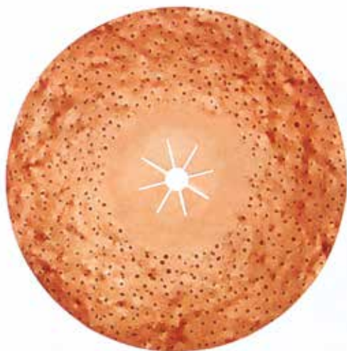
Dischi per macchine per pavimenti in CARBURO DI TUNGSTENO con abrasivo Ambo i lati da 400 e 430 mm. foro 25

Da 400 mm. € 102,00 Art. 100840001010 da gr. 10 Art. 100840001014 da gr. 14 Art. 100840001024 da gr. 24 Art. 100840001036 da gr. 36 Da 430 mm. € 107,80 Art. 100843001006 da gr. 6 Art. 100843001010 da gr. 10 Art. 100843001014 da gr. 14 Art. 100843001024 da gr. 24 Art. 100843001036 da gr. 36