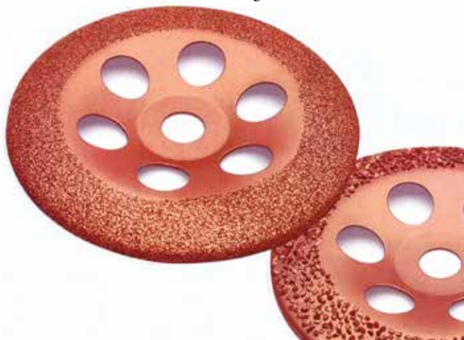
DISCHI IN CARBURO DI TUNGSTENO FONDO STONDATO DA 115-125-180 X 22 MM.

DA 180 MM. € 50,20 DISCO STONDATO DA 180 mm. gr. 14 art. 30021801014 DISCO STONDATO DA 180 mm. gr. 24 art. 30021801024 DISCO STONDATO DA 180 mm. gr. 36 art. 30021801036