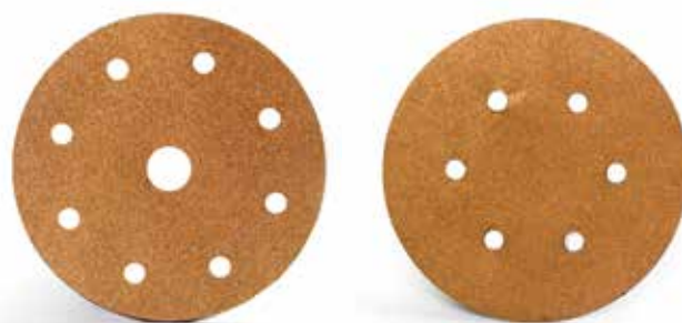
DISCHI VELCRATI DA 150 MM. DA 9 E 6 FORI

Da 150 mm. 6 fori € 20,50 Art. 3026150001024 gr. 24 da 6 fori Art. 3026150001036 gr. 36 da 6 fori Art. 3036150001060 gr. 60 da 6 fori Art. 3036150001080 gr. 80 da 6 fori Art. 3036150001120 gr. 120 da 6 fori