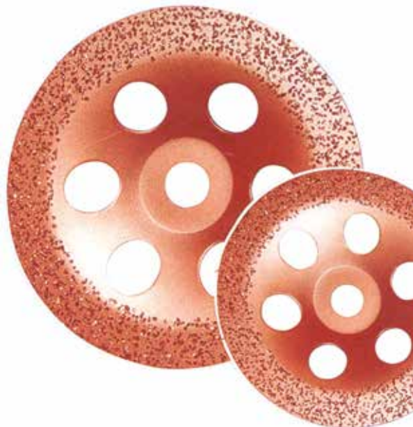
DISCHI IN CARBURO DI TUNGSTENO FONDO PIATTO DA 115-125-180 X 22 MM.

DA 180 MM. € 50,20 DISCO PIATTO DA 180 mm. gr. 14 art. 30011801014 DISCO PIATTO DA 180 mm. gr. 24 art. 30011801024 DISCO PIATTO DA 180 mm. gr. 36 art. 30011801036