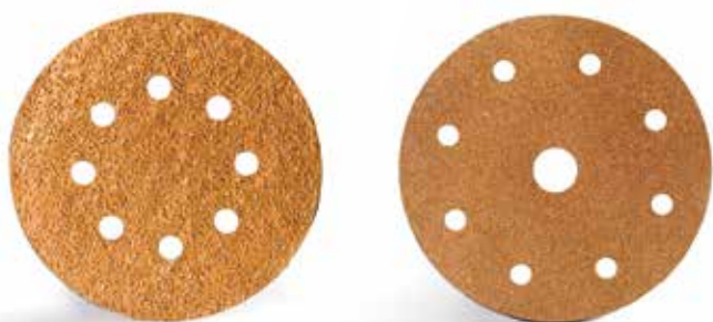
DISCHI VELCRATI DA 125 MM. DA 8 E 9 FORI

Da 125 mm. 8 fori € 18,40 Art. 3028125001024 gr. 24 da 8 fori Art. 3028125001036 gr. 36 da 8 fori Art. 3028125001060 gr. 60 da 8 fori Art. 3028125001080 gr. 80 da 8 fori Art. 3028125001120 gr. 120 da 8 fori